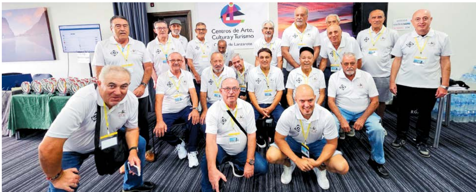
Miembros del Club Deportivo Etoraznal.