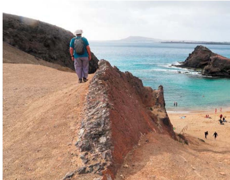
Excursión al Barranco de las Pilas en el año 2022.