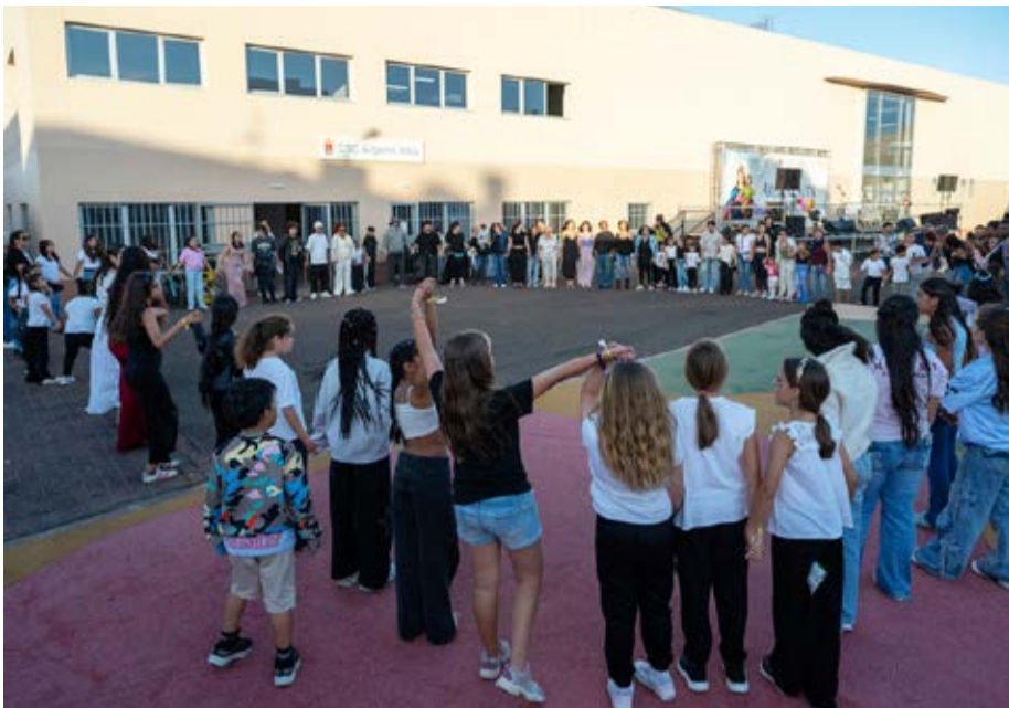
Antes de empezar, unieron sus manos en un círculo de energía.