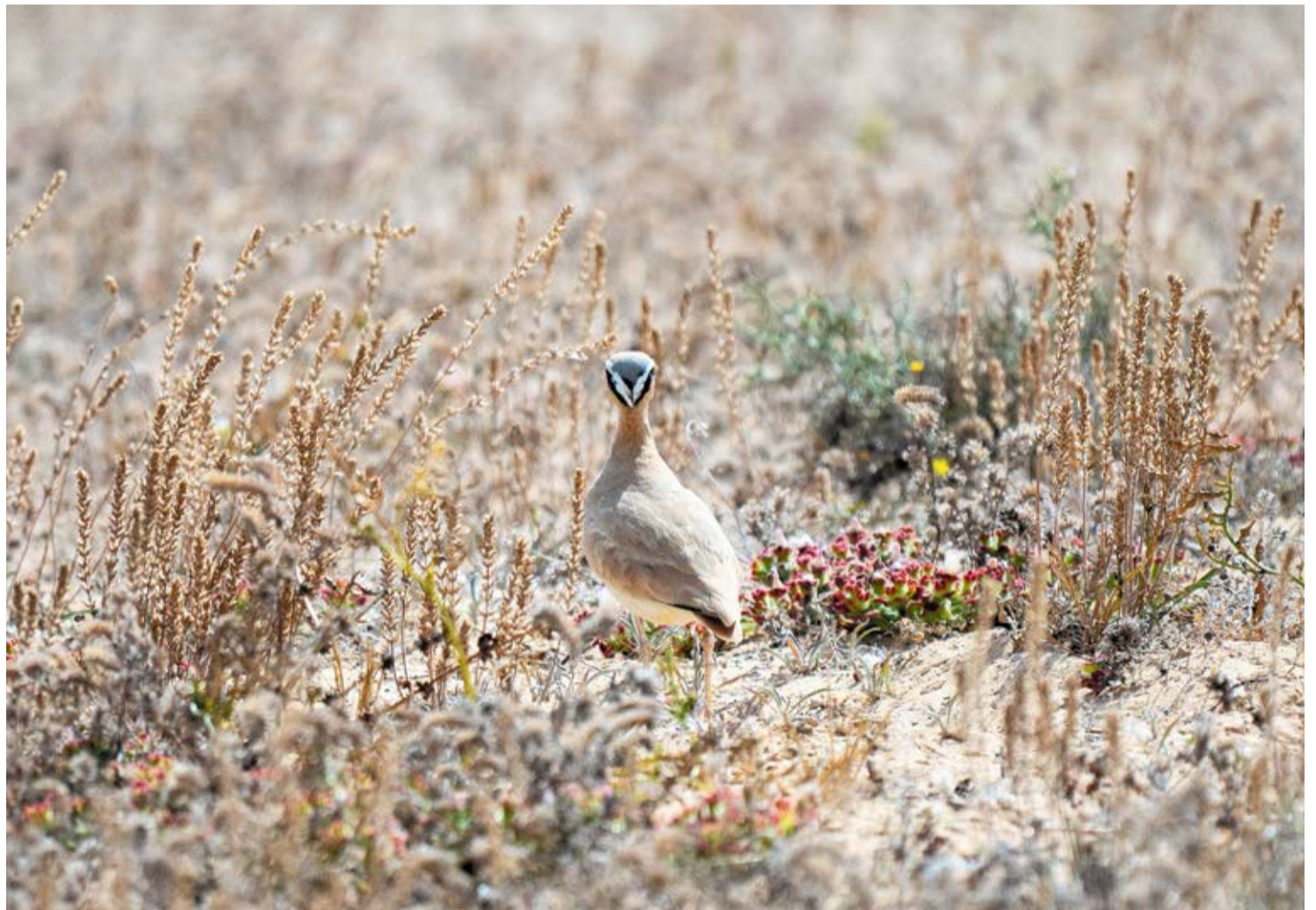
Corredor sahariano.

El siguiente dato que aparece es de 2012, y en lugar de aumentar, el número de ejemplares desciende. El estudio llamado Tendencias poblacionales recientes y distribución de aves estepáricas en las Islas Canarias orientales , elaborado por el Grupo de Rehabilita-