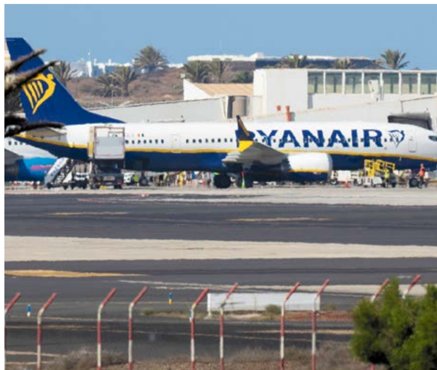
Un avión de Ryanair en el aeropuerto de Lanzarote.

Cuando se encontró con la desagradable sorpresa de que no podía utilizar esa tarjeta regalo para volar a la Península, lo primero que hizo María fue contactar con Ryanair, a través del chat de la aerolínea, y guardar esa conversación. El operador le hizo distintas preguntas, desde la numeración de la tarjeta hasta el correo electrónico que se utilizó en la compra, para terminar llegando al mismo punto: “No hay opción de usar la tarjeta regalo para pagar vuelos naciona-