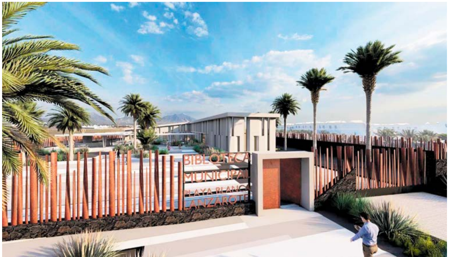
Infografía de cómo quedaría la nueva biblioteca en Playa Blanca.

Las actuaciones previstas incluyen intervenciones en Femés, Yaiza, El Golfo y Uga, donde el Ayuntamiento sureño prevé aportar financiación complementaria al proyecto de sa-