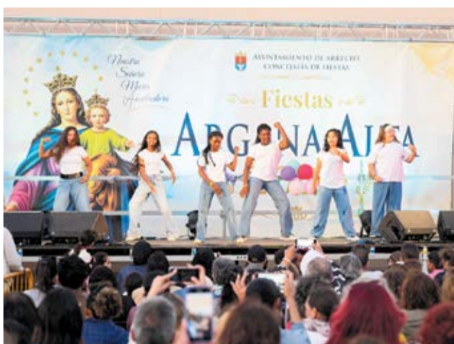
Las seis niñas que dieron vida a Katseye.