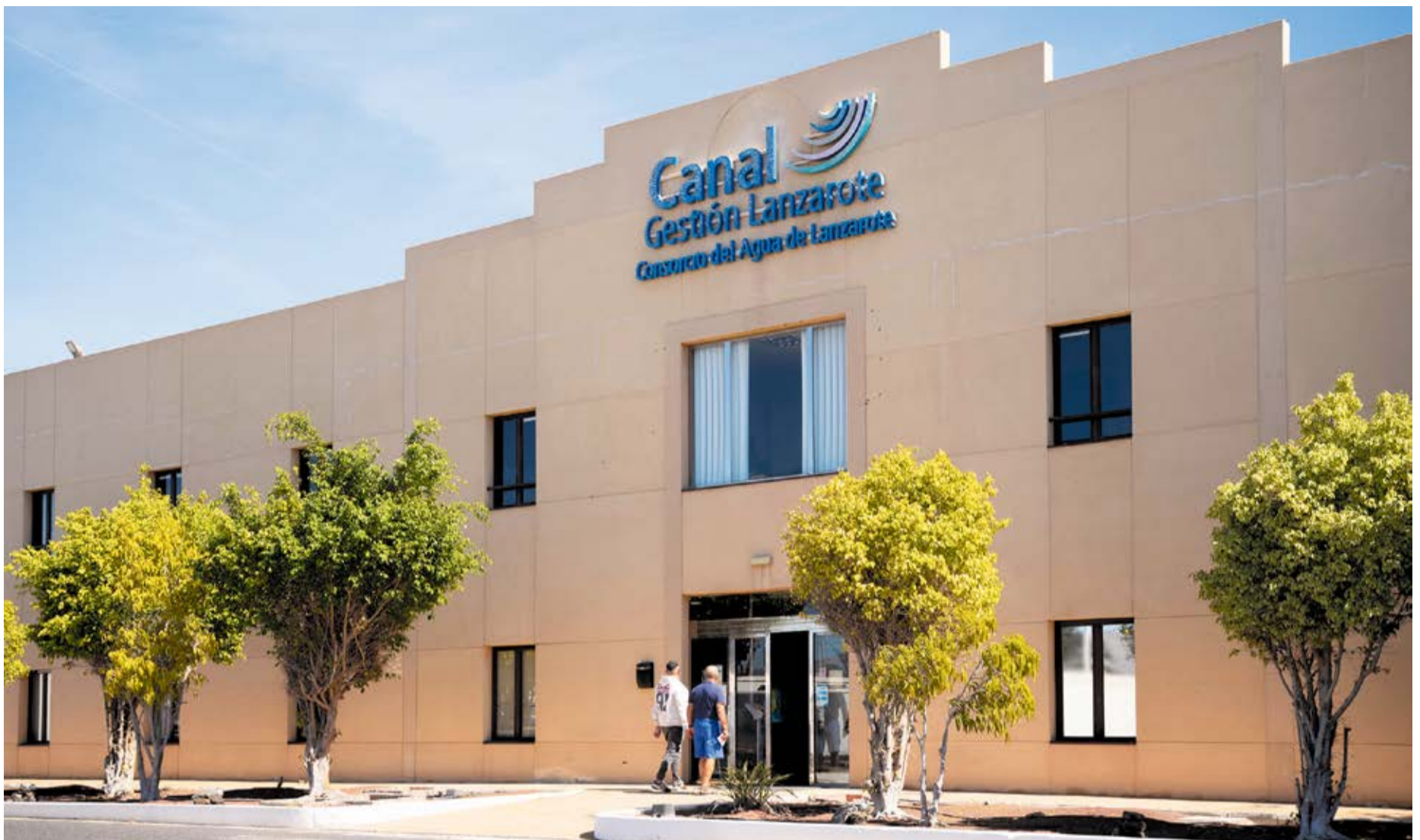
Oficina de Canal Gestión en Punta de los Vientos.