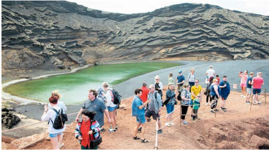
Mirador del Charco de los Clicos, un lugar en creciente masificación.