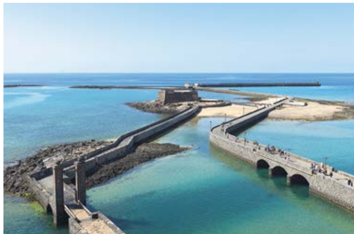
Castillo de San Gabriel.