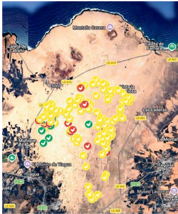
Avistamientos desde el año 2020. En verde, los de este año.

Ambos destacan que la agricultura tradicional en El Jable, por su forma de cultivo, favorece la presencia de las aves esteparias, pero el abandono del campo es cada vez mayor en la zona, o se planta forraje, que no atrae a estos animales. El corredor es esencialmente carnívoro, así que el grano no le interesa. “El corredor es muy especial, le gustan las zonas abiertas, sin roca, sin vegetación, no muy in-