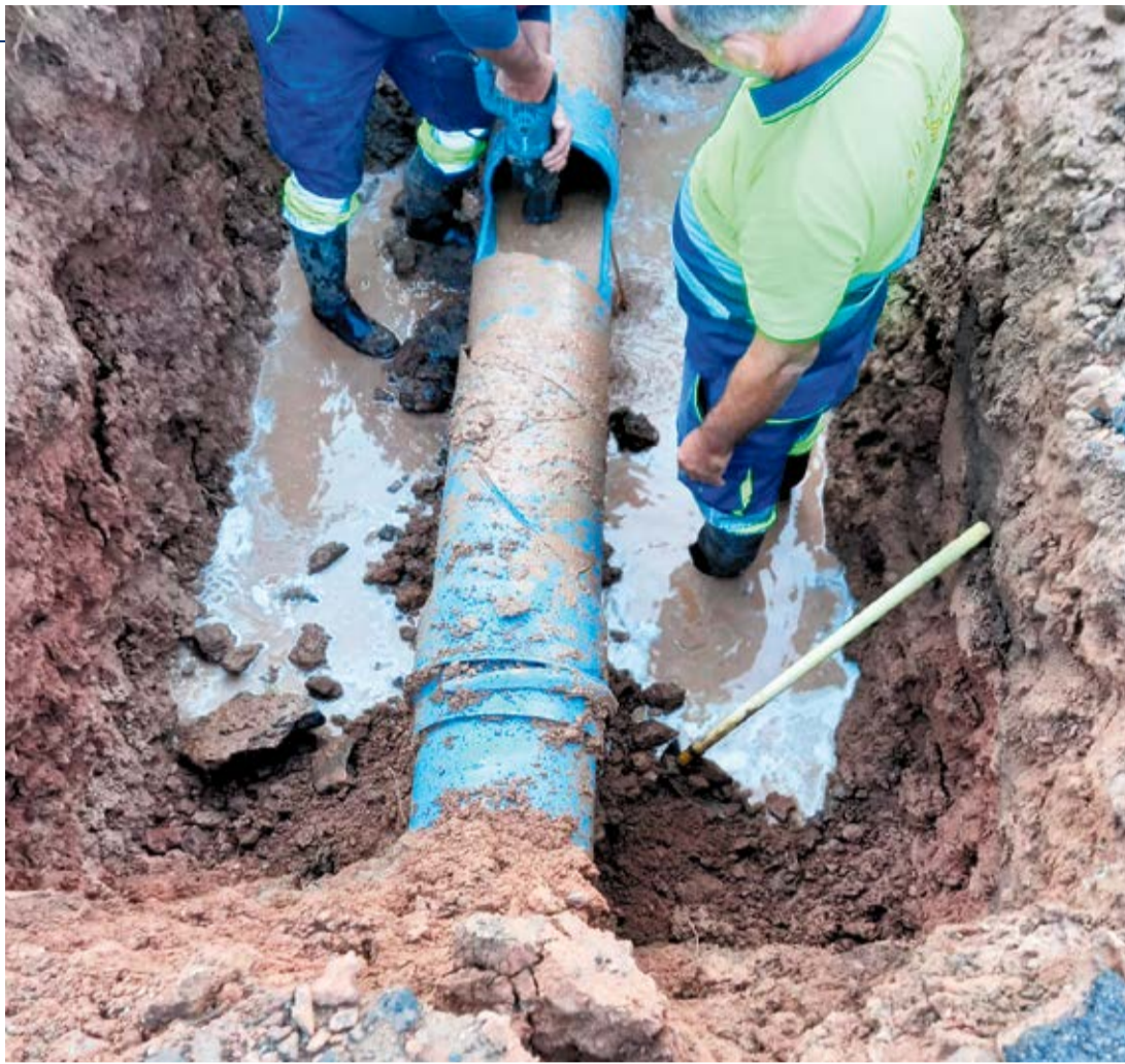
Operarios arreglan una tubería de conducción de agua.

Canal considera que el secuestro carecía de “cobertura legal” en el marco de un procedimiento de resolución contractual, además de que los motivos no eran suficientes y la medida no era proporcional. Expuso cuatro motivos: falta de cobertura legal, falta de justificación del periculum in mora , el incumplimiento del procedimiento y la falta de concurrencia de los requisitos materiales de la intervención; en particular la inexistencia de una perturbación grave, así como el carácter