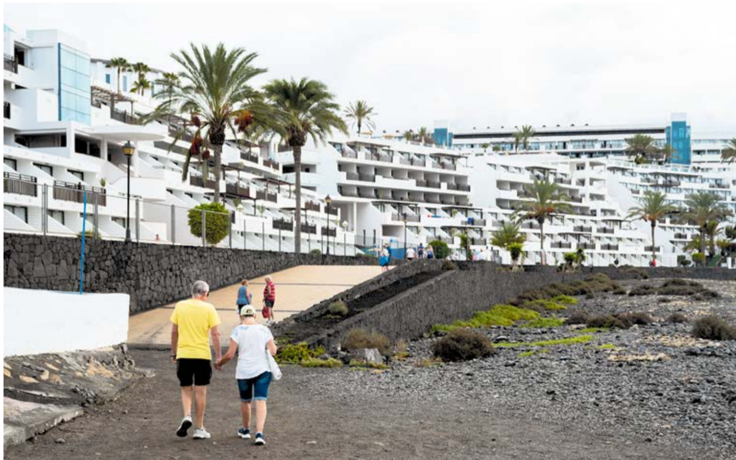
Hotel Sandos Papagayo, antiguo Papagayo Arena.

El estudio SOS Costas Canarias , elaborado con datos oficiales, exige dos medidas inmediatas para salvar esta situación crítica: paralizar cautelarmente nuevos planes parciales y proyectos urbanísticos ubicados junto al litoral y revisar los Planes Insulares y el planeamiento municipal con participación