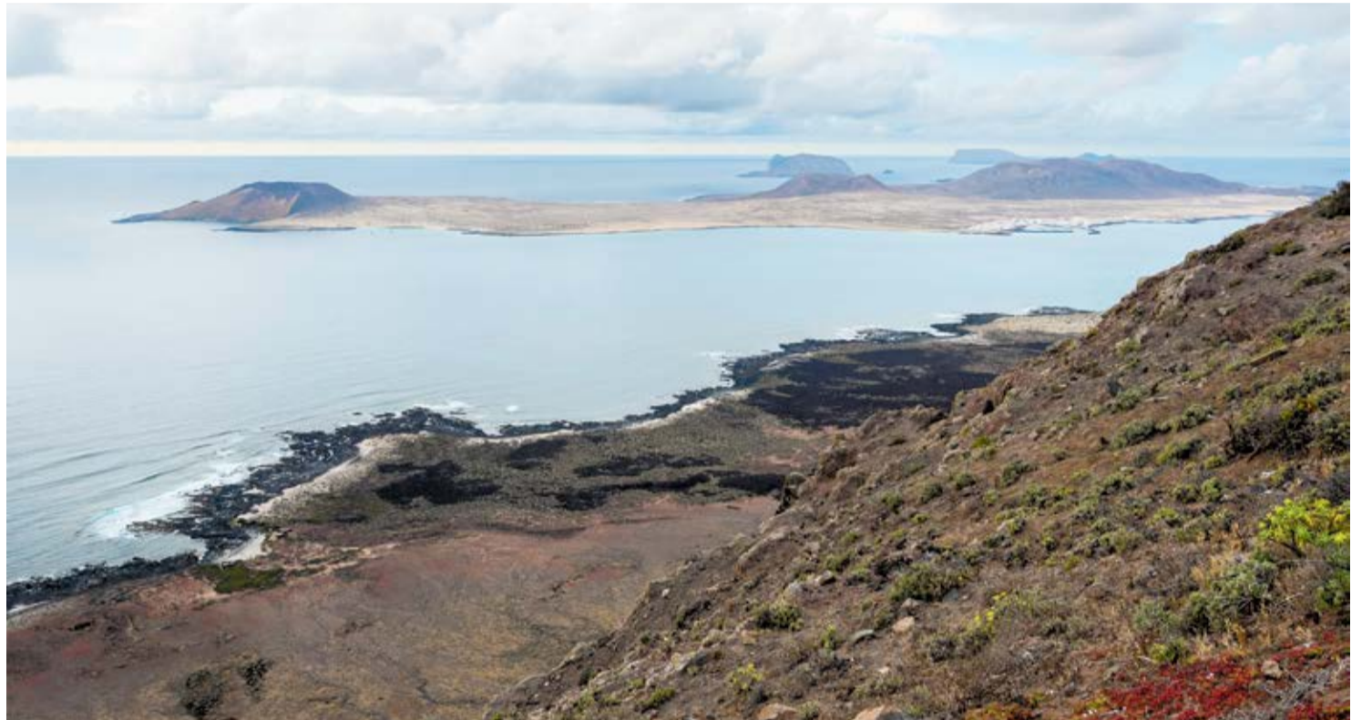
Vista de La Graciosa desde Lanzarote.

Pero más que la geografía, las principales respuestas para comprender una situación que ahora puede sorprender a los usuarios de estas tranquilas playas está en el contexto histórico de ese periodo y en la mala defen-