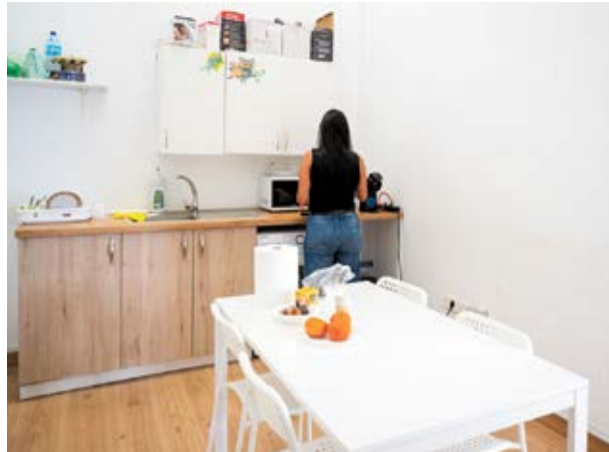
El Punto de Encuentro está equipado para la comodidad de menores y progenitores.