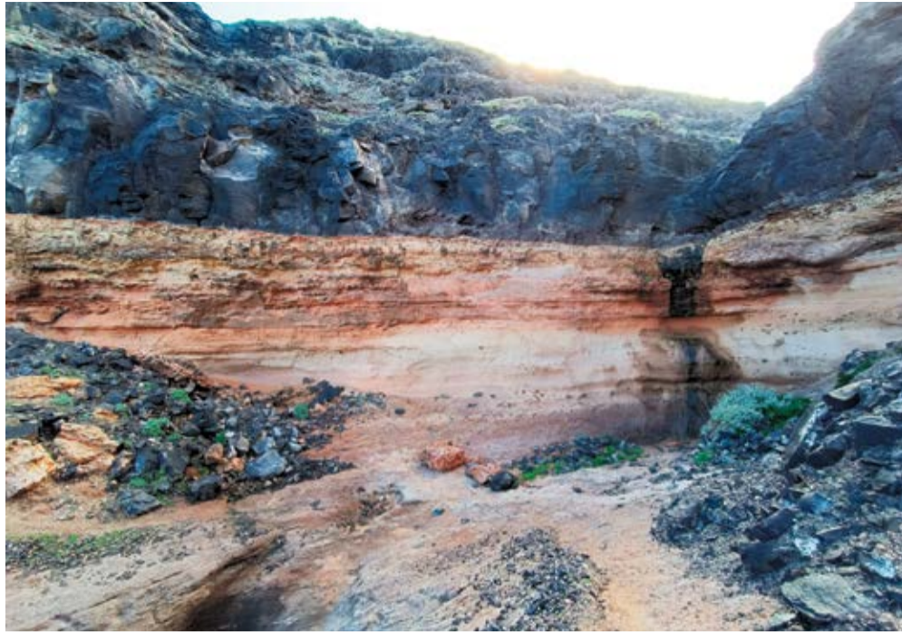
Ruta a Valle Grande y Valle Chico en Órzola.

que han llegado al Archipiélago y se han hecho prácticas de laboratorio y de campo centradas en la comprensión del efecto que tiene la geología aplicada en la vida cotidiana.