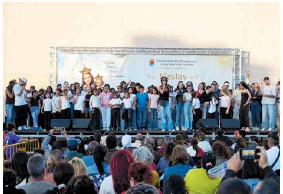
Artistas y voluntarias de La vida es zuaina, sobre el escenario.