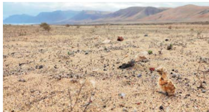
Una cría de corredor en El Jable.

en la literatura científica pero lo sabemos, el problema es que no podemos usar ciertas informaciones que no están en la literatura científica para las alegaciones ante la administración”. Los registros de las observaciones de Desert Watch documentan la existencia de pollos en verano.