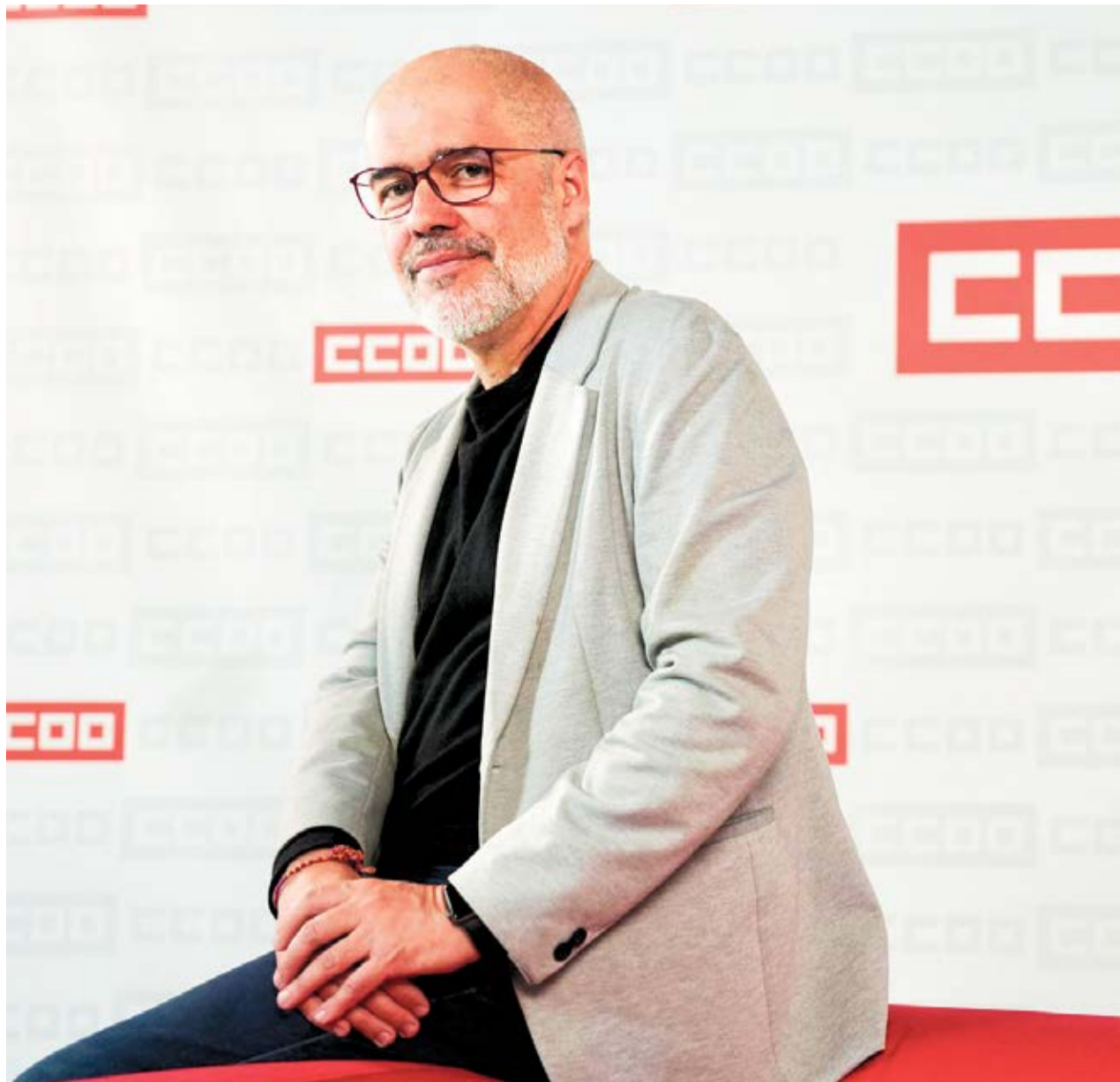
Unai Sordo.