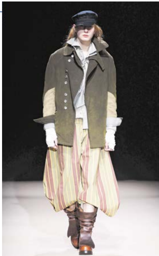
Diseños para la marca Eaftimos que desfilan en Madrid.

-Son todo. El tejido es el primer lenguaje de una prenda. Puedes tener el mejor patrón del mundo pero si el tejido no acompaña, la pieza no funciona.