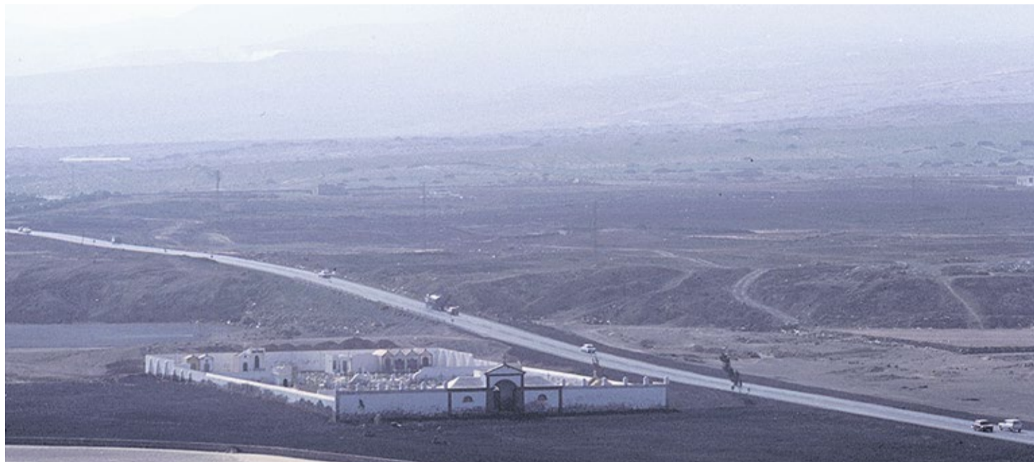
Foto del antiguo cementerio de Arrecife situado al lado de la orilla de la playa de El Reducto, junto a la zona donde hoy se encuentra la sede del Cabildo de Lanzarote y el intercambiador de guaguas. Imagen de los 70.

Fue el rey Carlos III el que promovió una Real Orden en 1787 que promulgaba la creación de los camposantos en las afueras de las ciudades, prohibiendo a su vez los enterramientos en los interiores y cercanías de las iglesias. Detrás de dicha medida estaban las ideas de progreso de la Ilustración, aunque de forma más directa se señalaba lo insalubre de dicha tradición funeraria, especialmente en épocas de epidemias.