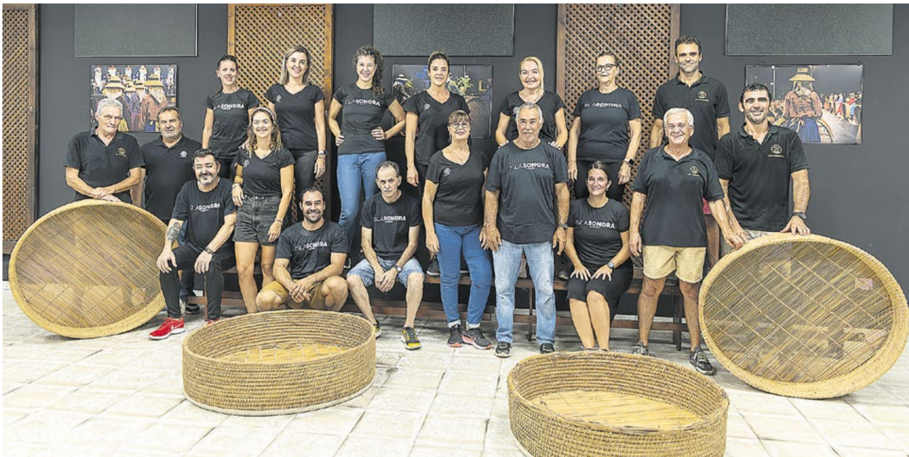
La agrupación tiene su sede en Argana Baja, donde conserva parte de la historia de sus 60 años de existencia.