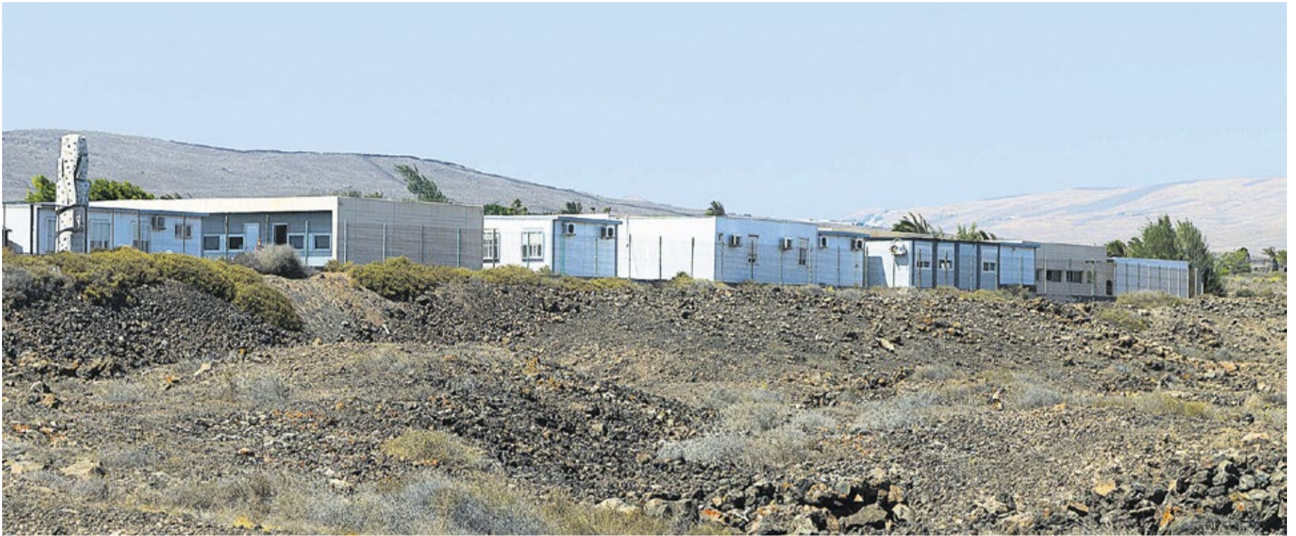
Barracones en Costa Teguisse, a la espera de construir el nuevo centro.