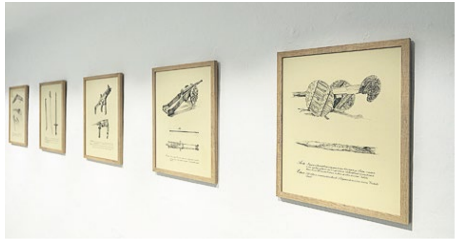
Imágenes de la exposición colectiva.