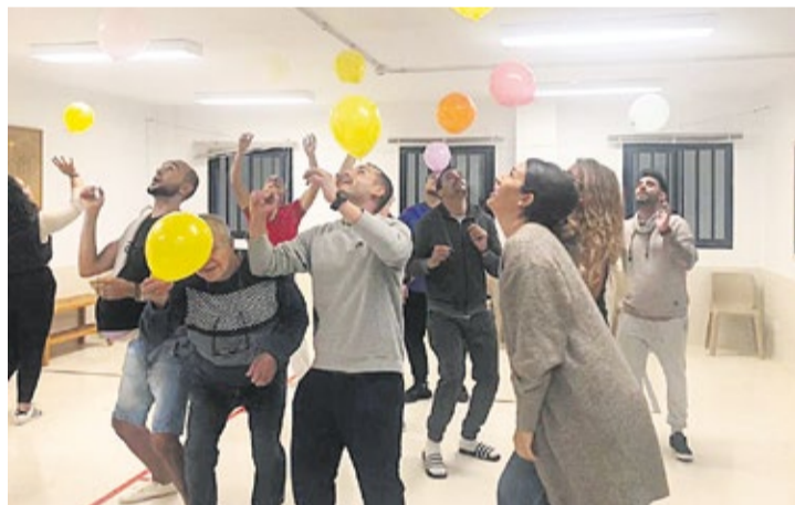
Un momento del taller en la cárcel.

“Al taller las mujeres van entregadas y los hombres, asustados”