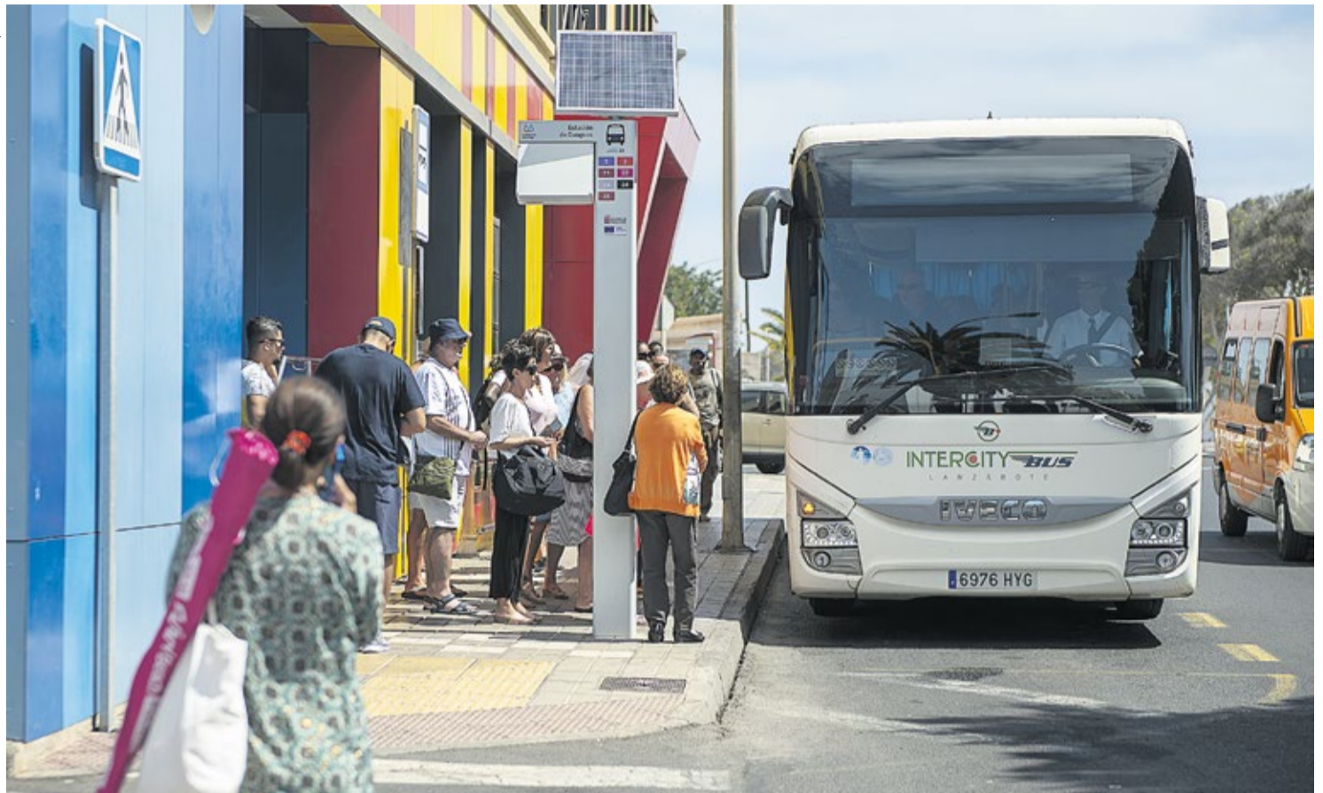
Usuarios agolpados en la Estación de Guaguas de Arrecife.

El nuevo consejero insular de Transporte apunta que es prioritario actualizar el Plan de Mo-