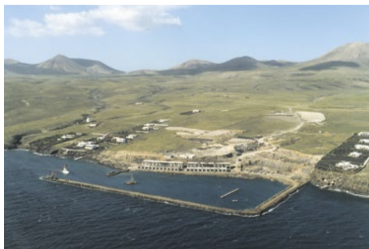
Puerto Calero, en obras, en una imagen de 1987.