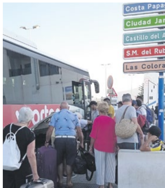
Nuevos paneles más orientativos que informativos. A la derecha, pasajeros en la parada de Playa Blanca.