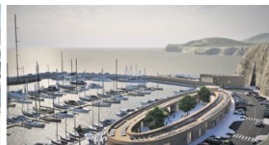
Infografía de Marina Jandía.