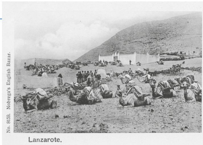
Postal de un grupo de camellos frente al cementerio de Femés a finales del siglo XIX.