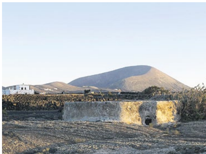
Fotogramas del cortometraje.

Unos se leen en español y otros en inglés.