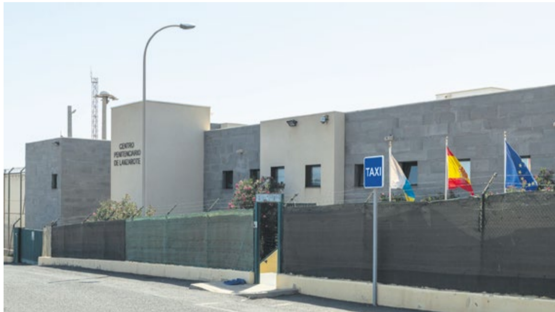
Centro penitenciario de Tahíche.

Unos 150 internos del centro penitenciario de Tahíche asisten a un taller de risoterapia, una forma de tratar la salud mental y dar herramientas para afrontar el futuro