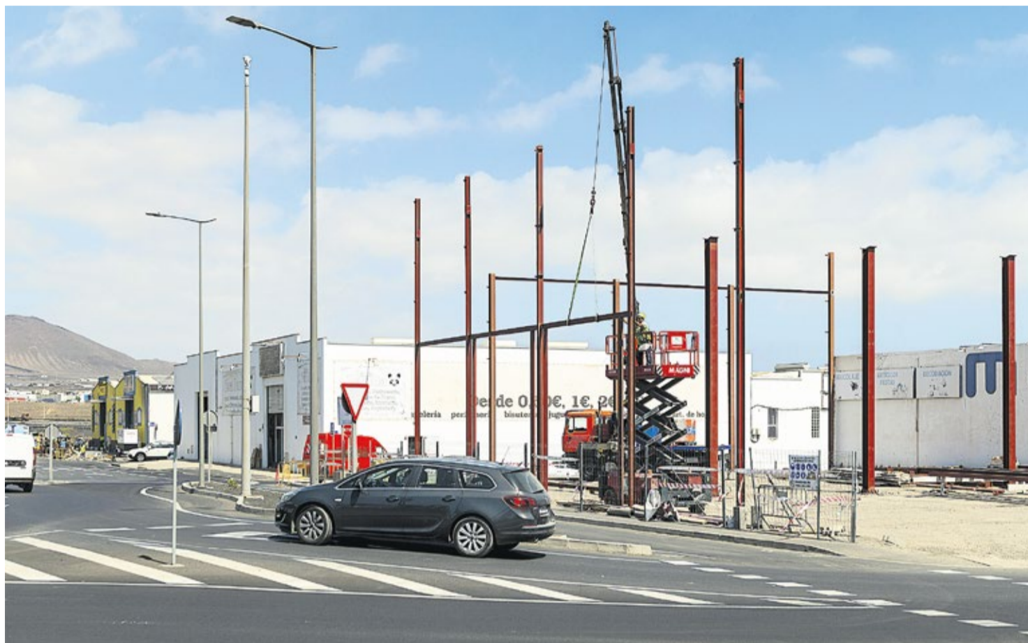
En Tenorio, sin plan parcial aprobado, el Ayuntamiento concede licencias para “naves desmontables”, sin derecho a indemnización.

Auge residencial. La falta de vivienda en la capital de Lanzarote se ha convertido en uno de los principales quebraderos de cabeza de los ciudadanos. Sin embargo, en los próximos años podrían entrar en el mercado