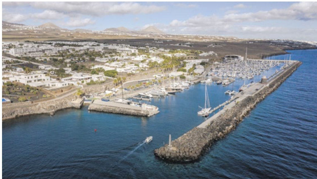
Puerto Calero, el primer puerto deportivo de Lanzarote.