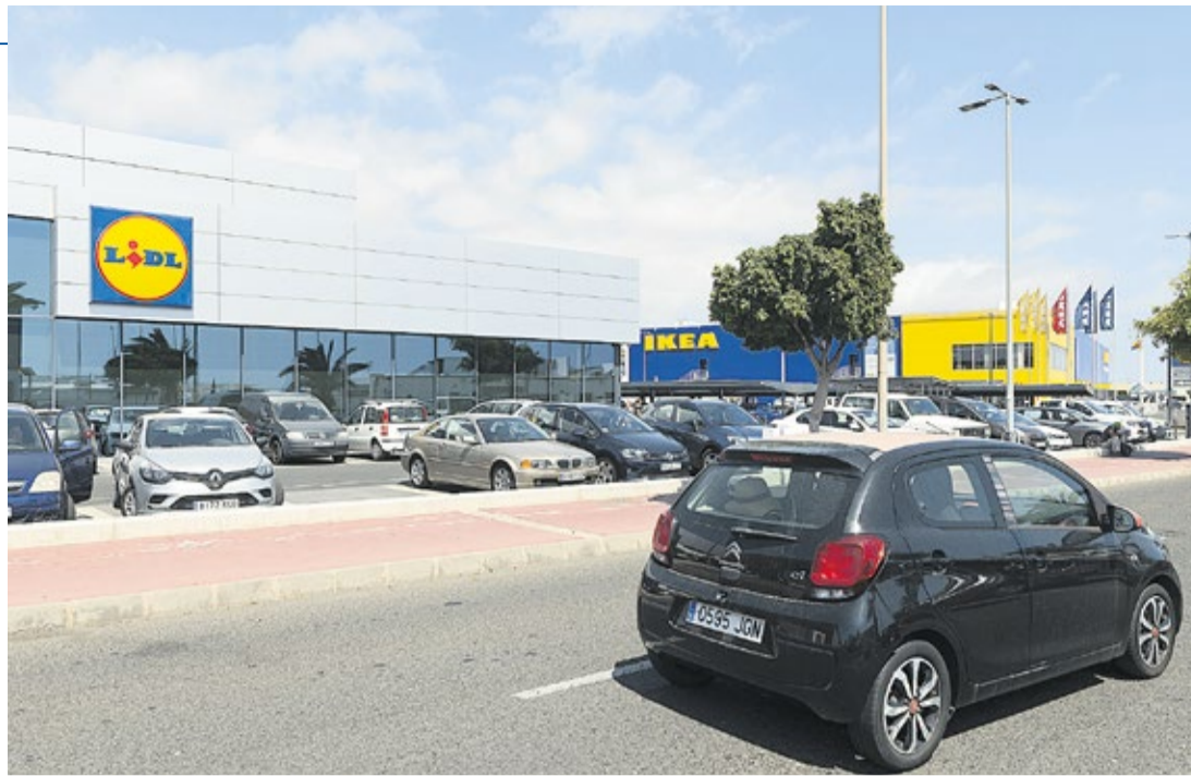
En el polígono de Ikea, el Consistorio va a tener que revisar de oficio la urbanización por sentencia judicial.