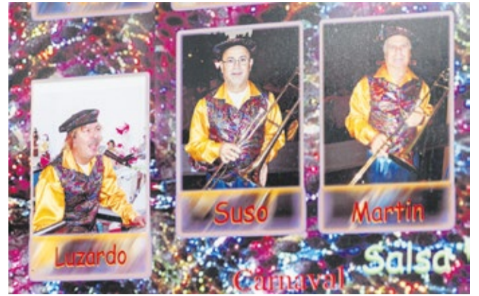
Imágenes para el recuerdo de Salsa Verde.

en el equipo de mantenimiento del Hospital Doctor José Molina Orosa”. Ya anteriormente, en el Círculo de Amigos de la Música, cursó dos años de trompeta gracias a que venían docentes del Conservatorio de Las Palmas de Gran Canaria a examinarlos.