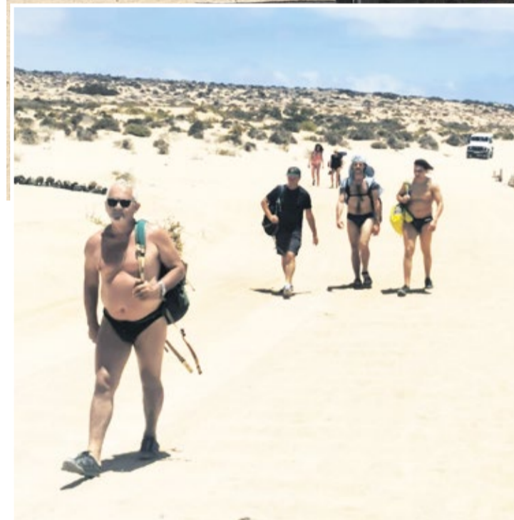
Miembros de la asociación, en La Graciosa.

ra no molestar al ave”, pero sin embargo, “desde el camino de arena adyacente pasaban continuamente vehículos a muy alta velocidad, cargados de turistas hacia y desde la Playa Francesa”. Dicen que, según les informaron “los operadores del servicio de seguridad”, la velocidad máxima permitida en esa zona es de 30 kilómetros por hora, pero que la velocidad estimada de esos vehículos está entre los 50 y los 60 kilómetros por hora. “Nos preguntamos por qué se tolera esta práctica”, señalan en su carta y se preguntan también qué medidas va a tomar el Cabildo de Lanzarote para resolver el problema.