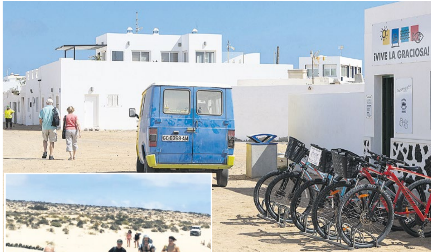
Isla de La Graciosa.

La asociación ambientalista y cultural Natura Sicula envió una carta de denuncia al Cabildo de Lanzarote en el mes de junio y ni siquiera ha recibido respuesta