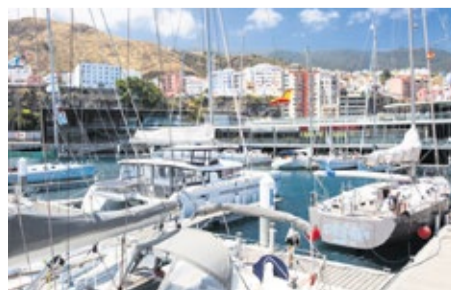
Marina La Palma.