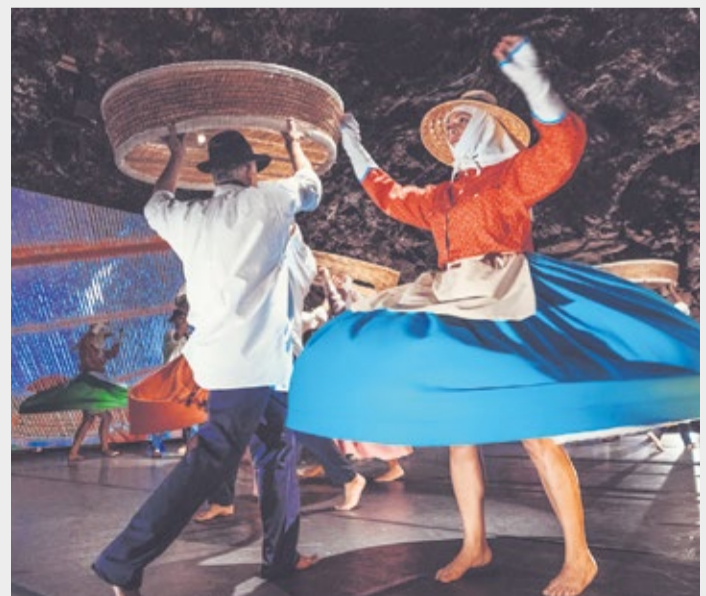
Baile de la saranda.

Canarias por la labor destacada en la conservación del folclore de la isla de Lanzarote. Entre otros reconocimientos reciben el Cachorro de Honor y el Volcán de Plata de la agrupación Acatife. En 2014 presentan su último trabajo discográfico, ‘Desde Lanzarote’, con el que conmemoran el 50 aniversario del colectivo bajo la premisa de renovar desde la tradición. Ya en 2018 presentan ‘Isla Sonora’ en el auditorio de Jameos del Agua, un espectáculo que sincretiza la estética clásica y folclórica sobre la base sonora de la isla de Lanzarote. Otro espectáculo de altura fue ‘Mareantes’ que pudo escenificarse en 2022.