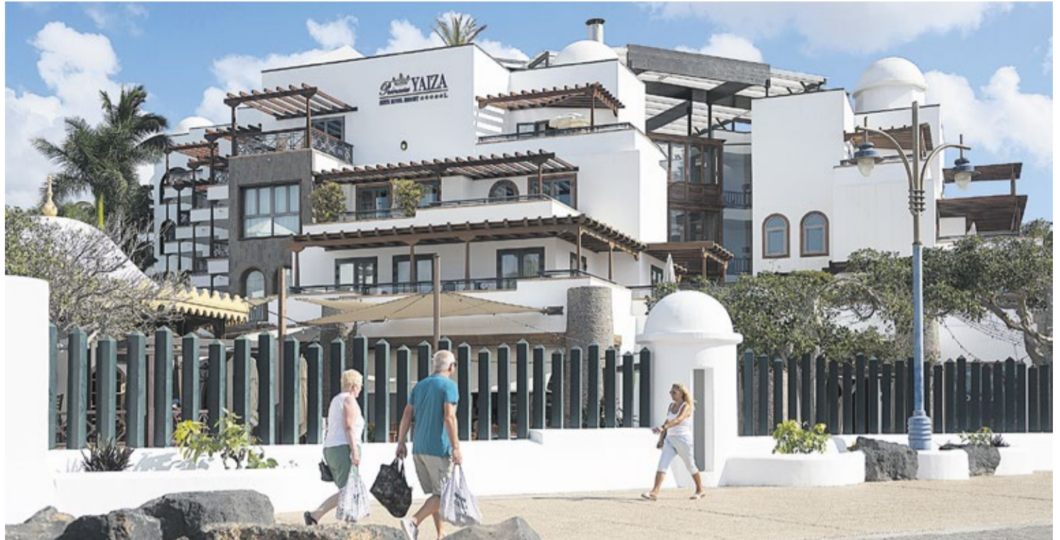
Turistas pasean junto al Princesa Yaiza.

La mayoría de los hoteles con licencia anulada tampoco tienen la autorización turística, a pesar de que llevan veinte años abiertos al público. El Hotel Princesa Yaiza es uno de ellos y ha pedido ahora al Cabildo esa autorización “de proyecto y clasificación