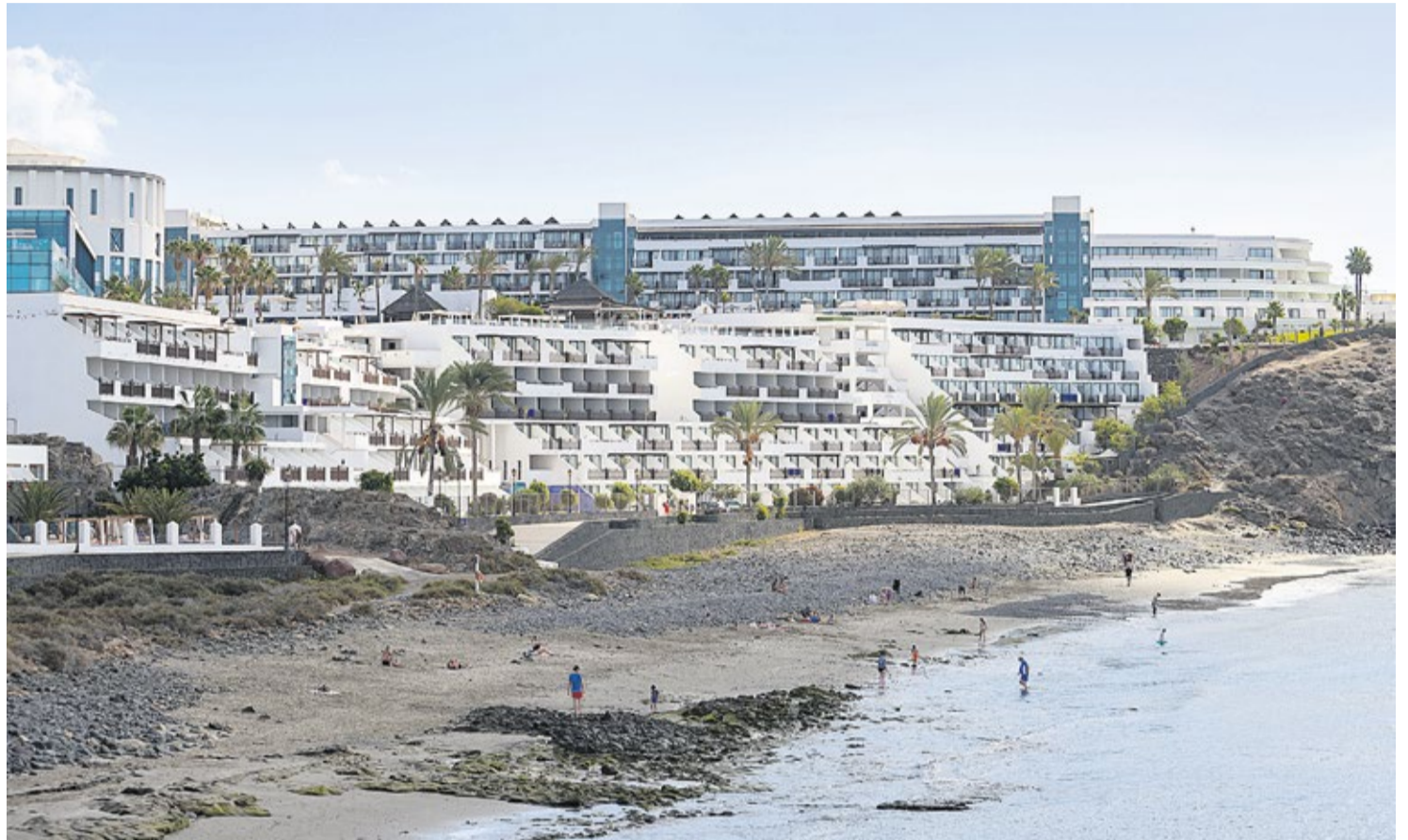
Hotel Papagayo Arena.

El Juzgado destacaba que ya ha quedado “comprobado el incumplimiento” en la ejecución de la sentencia por parte del Ayuntamiento de Yaiza, que es la institución pública que concedió las licencias y también es la demandada en el procedimiento