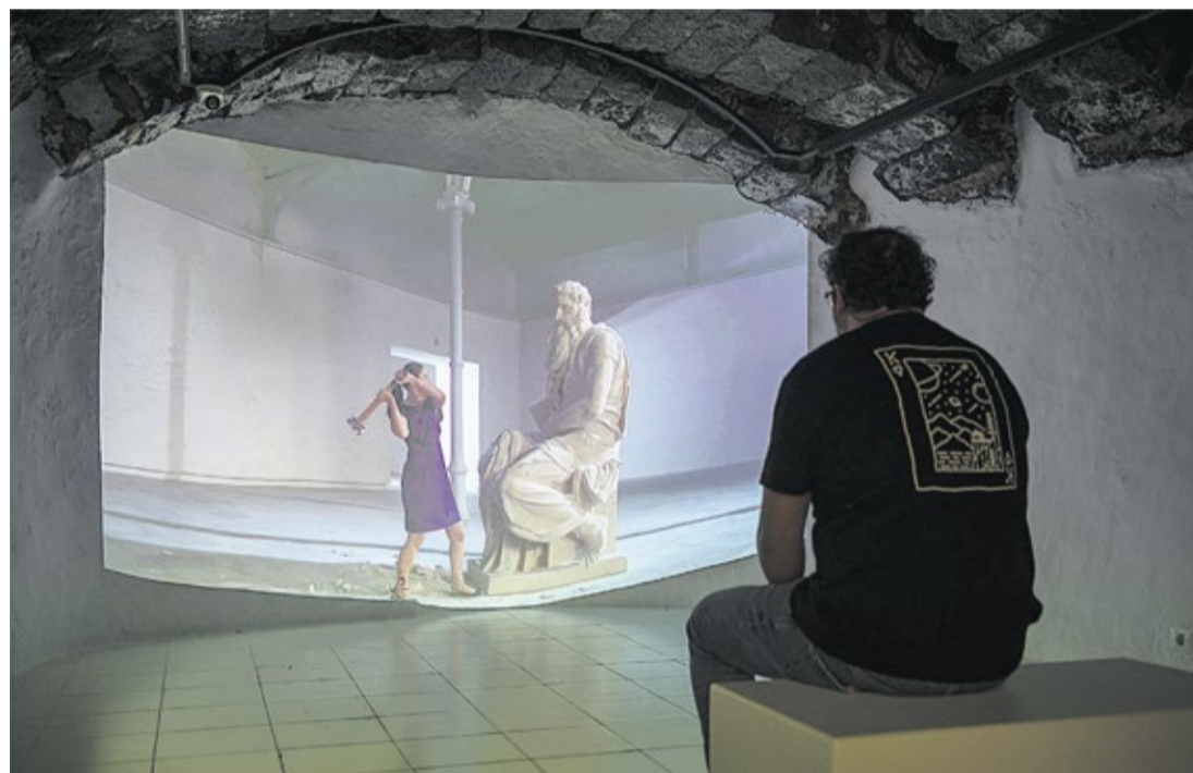
Un visitante contempla el vídeo donde Cristina Lucas la emprende a martillazos contra el Moisés.

El Almacén acoge una exposición colectiva que aborda la cultura de la violación desplazando el foco de atención de las víctimas hacia los perpetradores