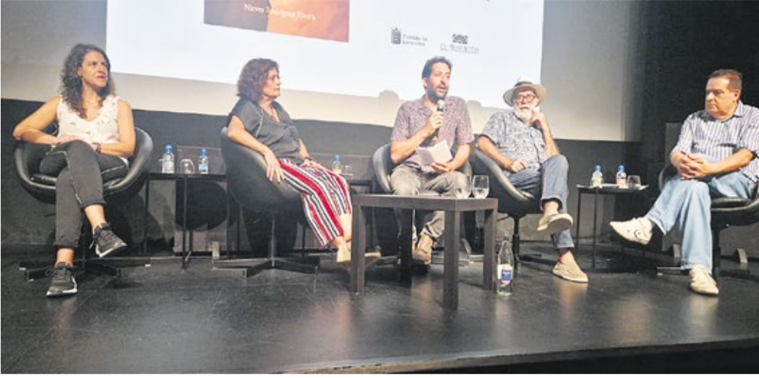
Acto de presentación de la obra.