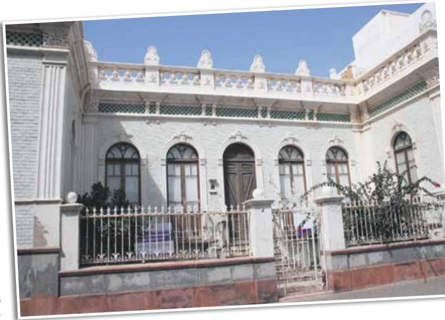
La casa Fajardo de Arrecife iba a albergar el Museo Arqueológico de Lanzarote.