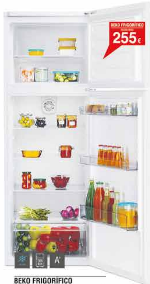
BEKO FRIGORÍFICO RDSA310M2

210 Litros - Eficiencia energética A+ - Termostato regulable - 143 cm de altura - descongelación automática en frigorífico - Cajón FreshBox