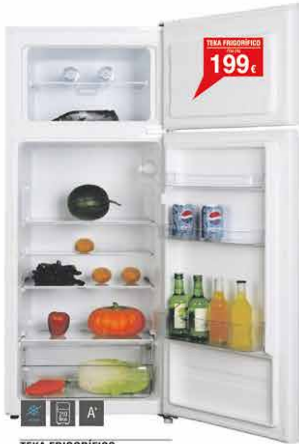
TEKA FRIGORÍFICO FTM-240

210 Litros - Eficiencia energética A+ - Termostato regulable - 143 cm de altura - descongelación automática en frigorífico - Cajón FreshBox