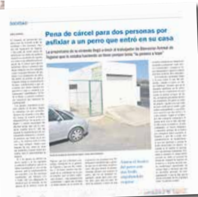
A la izquierda, Timple agonizando.

sión para sus responsables generaron en poco más de un mes un aluvión de respuestas en los medios de comunicación, con cientos de artículos informativos y de opinión, así como entradas en las redes sociales por parte de personas, organizaciones animalistas y partidos políticos, pero también de figuras