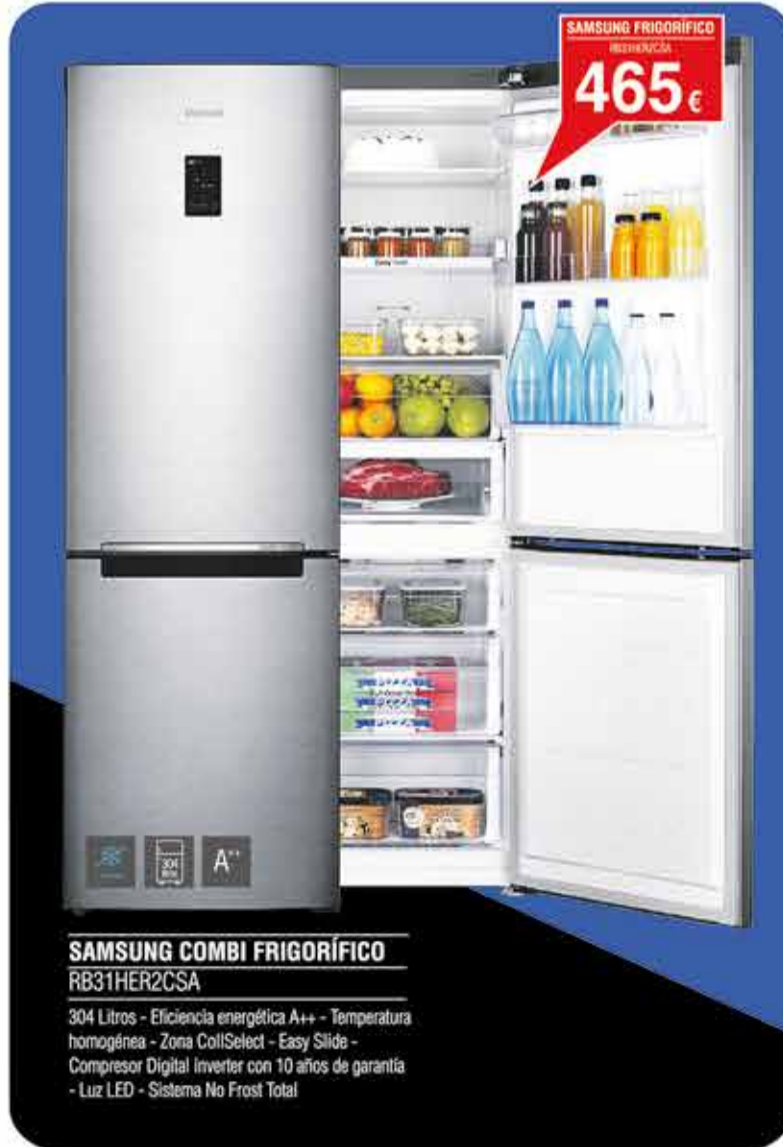
SAMSUNG COMBI FRIGORÍFICO RB31HER2CSA

355 Litros - Eficiencia energética A++ - No Frost - Display con botones fáciles - Modo vacaciones y función eco - Iluminación LED - Tecnología IonFresh - 202 cm de altura