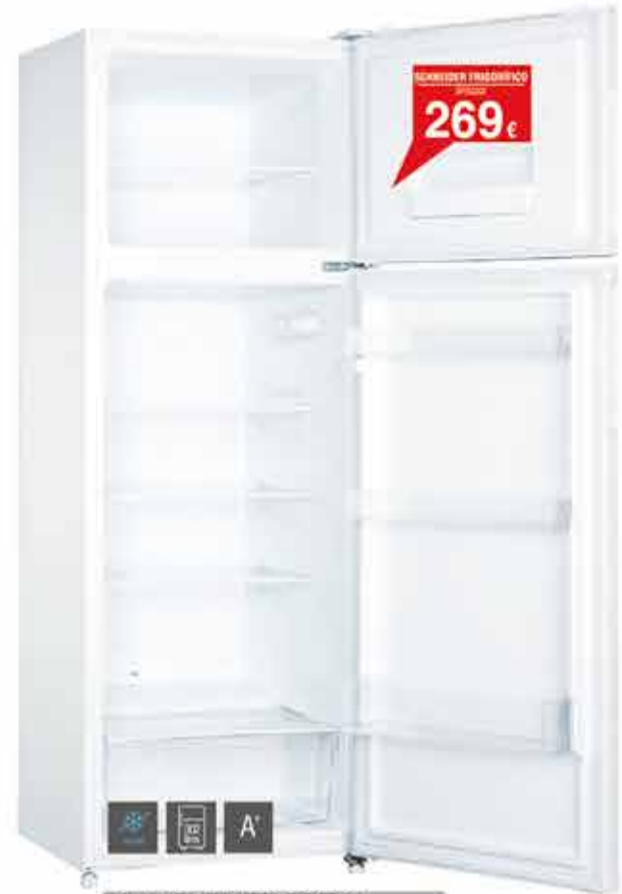
SCHNEIDER FRIGORÍFICO SFES3202

306 Litros - Eficiencia energética A+ - Sistema de frío Cíclico - Congelador MinFrost - 175.4 cm de altura