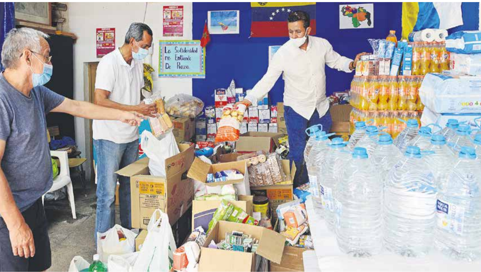
Sede provisional de las asociaciones, en Altavista.

ha aportado algo aquí”. Néstor Osorio, de Colombia, señala que no se trata solo del intercambio del que llega sino también del que ya está aquí, “también del que acoge porque no se segrega a nadie”. “En definitiva, que se hable de nosotros desde un concepto de residente, no de inmigrante –puntualiza– porque un documento no impide que una persona forme parte de una sociedad”.