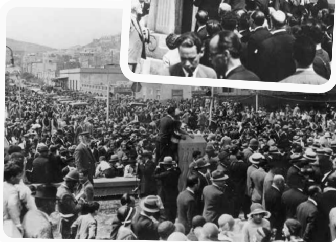
Inauguración del Monumento a Benito Pérez Galdós en Gran Canaria, en septiembre de 1930.

Colaboró en bastantes diarios españoles del momento, como El Liberal , El Globo , el Heraldo de Madrid y España . En París, entre 1908 y 1910, ejerció como corresponsal de un gran periódico, La Correspondencia de España . Mantuvo contacto permanente con Canarias, a cuyos diarios principales no deja de enviar crónicas. Su labor periodística, a veces muy crítica con la realidad social de aquel tiempo, lo convierte en un escritor temido por unos y censurado por otros. Su figura alcanzaría más notoriedad como narrador que como político. Publicó numerosas novelas y relatos, entre los que destacan aquellos que se desarrollan en Canarias. Sus temas predilectos son el mar, la vida campesina, la lucha por la supervivencia y la relación del ser humano con el medio. Su obra más celebrada por la crítica es La Lapa , relato corto en el que describe los sufrimientos y las penurias de Martín desde que es joven hasta que lo pierde todo tras un horrible naufragio. La Lapa es la epopeya de un hombre de las Islas Canarias, de humilde procedencia, que comparte protagonismo con otro personaje simbólico: el mar.