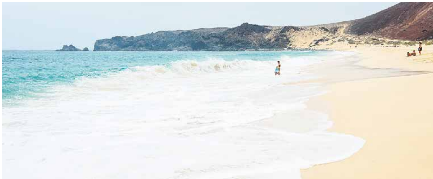
Playa de Las Conchas, en La Graciosa.

Uno de los proyectos es de adecuación de áreas de esparcimiento y descanso y se ubica en dos antiguos vertederos sellados en 2010, cerca del sendero de acceso a la playa de Las Conchas. Se trataría de una zona de esparcimiento de unos 400 metros cuadrados, con mobiliario