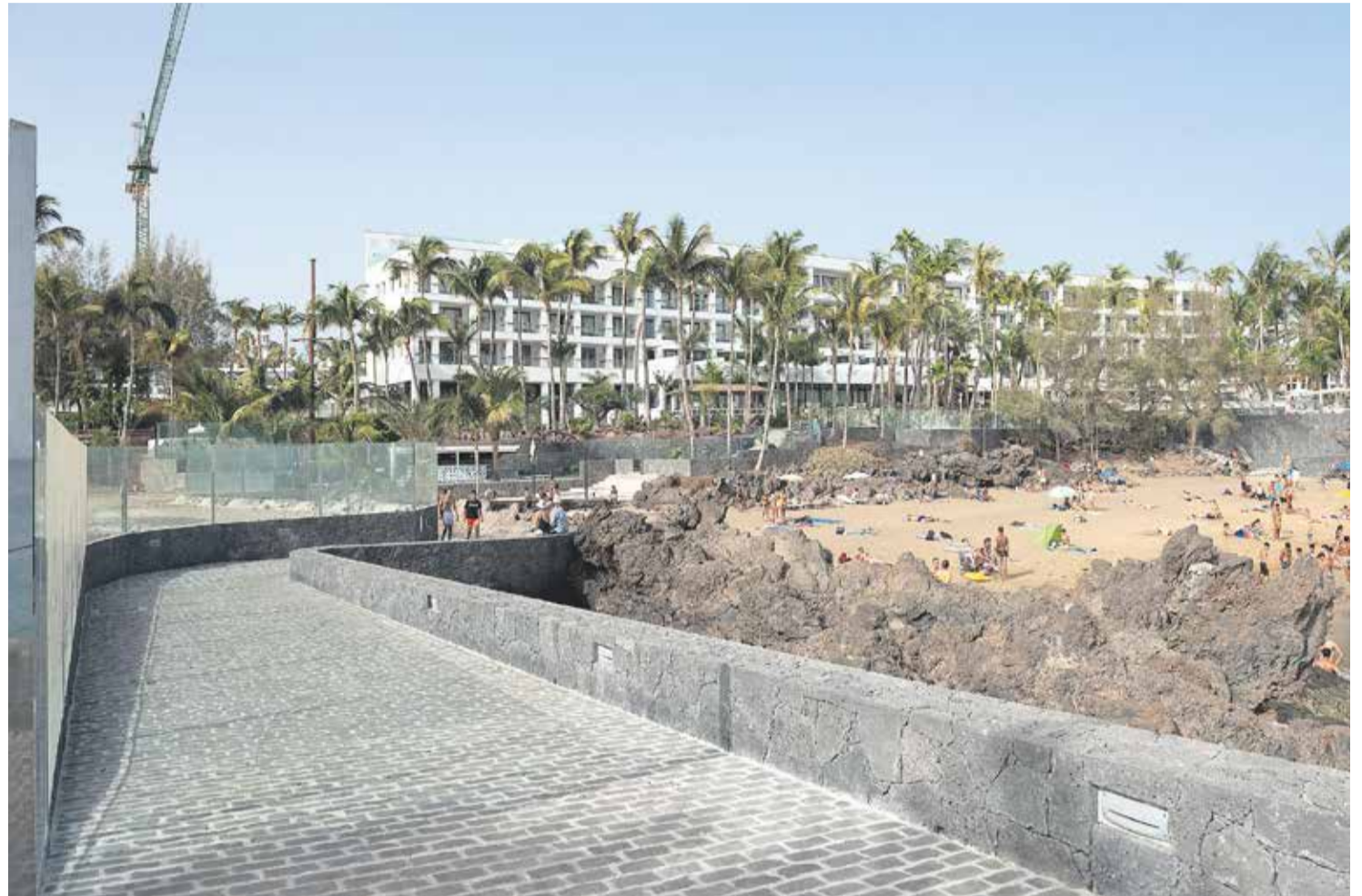
Pasarela del Hotel Fariones.

Ahora, la propia consejería deberá decidir si esa autorización se ajusta a Derecho. Fuentes jurídicas consultadas por Diario de Lanzarote señalan que el spa podría no ser autorizable en base a la Ley de Costas, ya que se trata de una construcción nueva techada y en servidumbre. Habitualmente, se permite la consolidación de infraestructuras ya existentes pero no de infraestructuras nuevas. El spa, que sustituiría a la pista de tenis, sí se podría haber construido sin ningún impedimento dentro del edificio principal del hotel.