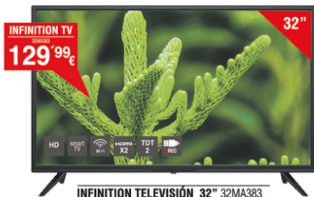
INFFINATION TELEVISIÓN 32" 32MA383 Televisión LED de 32" HD - USB Multimedia - Smart TV con Android - 16 W de sonido - WiFi - TDT 2 - 2 x HDMI