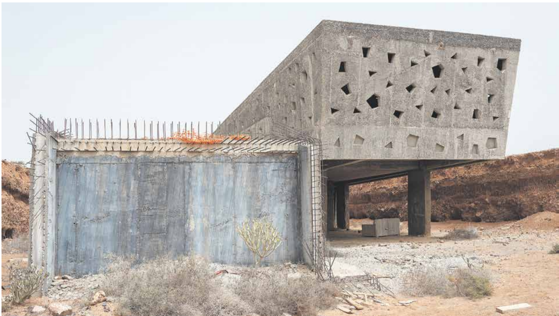
El que iba a ser el Museo de Sitio de Zonzamas, abandonado.