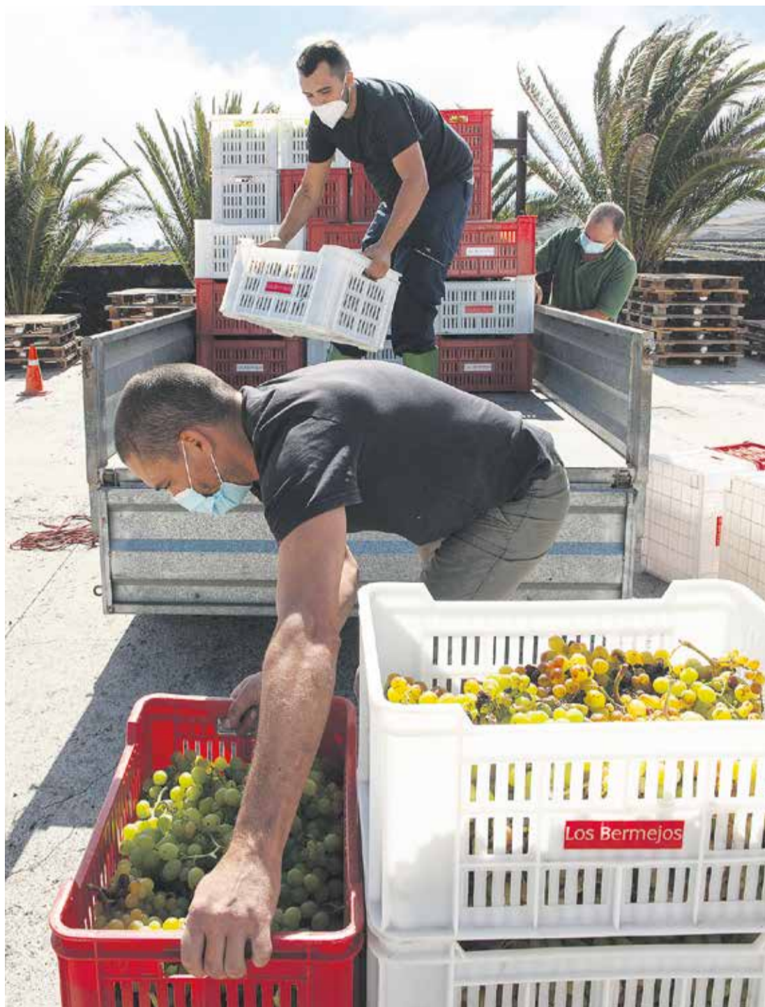
Los viticultores entregan la uva antes de su procesado.

re de una maduración más lenta que la malvasía, por lo que hay que cogerla en el punto idóneo de maduración. “En Lanzarote se tiende a cosechar demasiado pronto, pero para conseguir un buen vino de listán negro tiene que estar bien maduro el fruto”, explican los enólogos. En el mercado se pueden encontrar tintos de maceración carbónica, listán negro tradicional y listán negro rosado que, a pesar de no contar con el respaldo del comercio español, es excelentemente recibido en el de Estados Unidos, incluso por encima de la malvasía volcánica. No en vano,