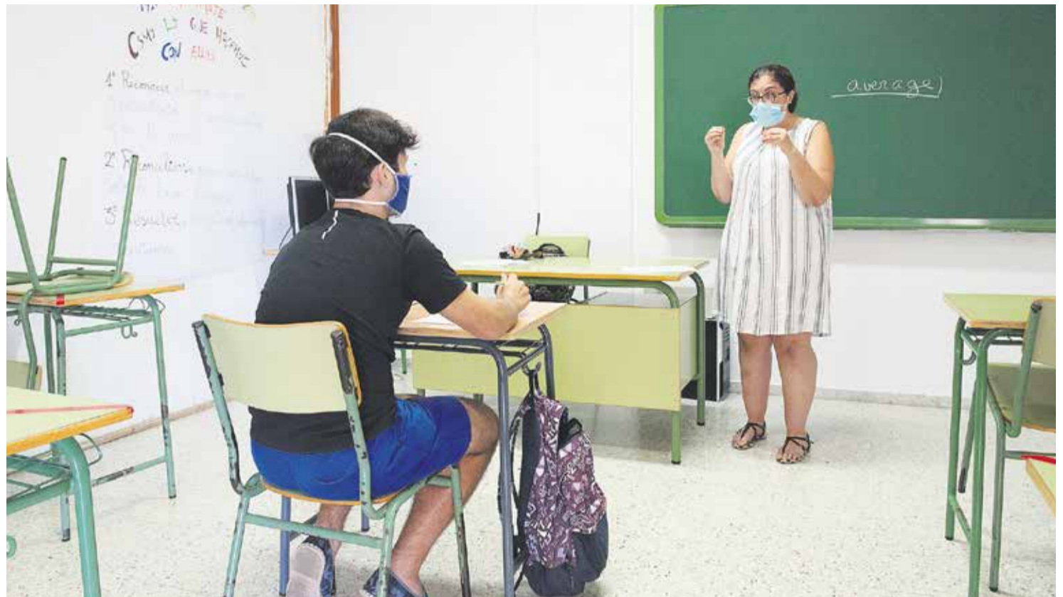
Las ratios son uno de los caballos de batalla de los sindicatos.

La incertidumbre planea sobre la vuelta al cole ante la duda de si abrirán los centros, mientras docentes y familias reprochan la ausencia de planes específicos