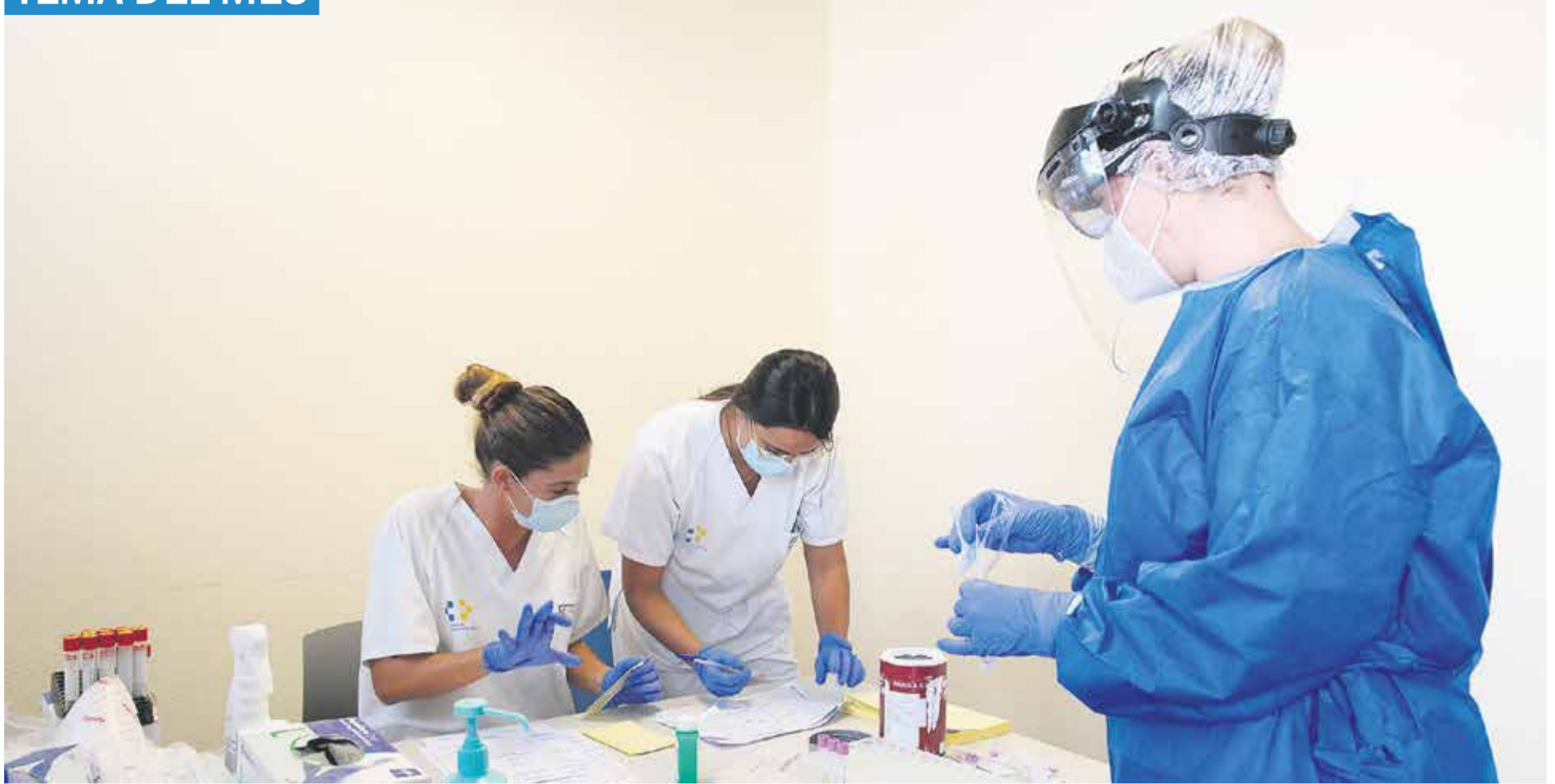
Profesionales procesan muestras en una de las salas habilitadas en el Hospital.