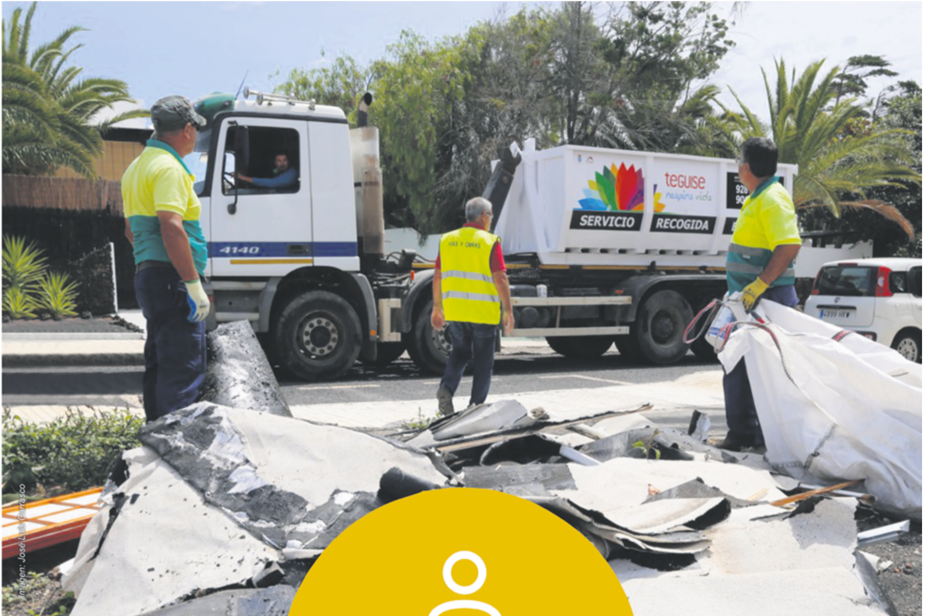
Imagen: José Luis Carrasco