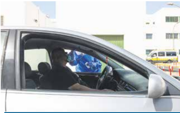
TOMA DE MUESTRAS. En el Hospital Molina Orosa se ha dispuesto un COVID-Auto para recoger muestras sin bajar del automóvil y se prepara otro espacio similar en el recinto ferial.