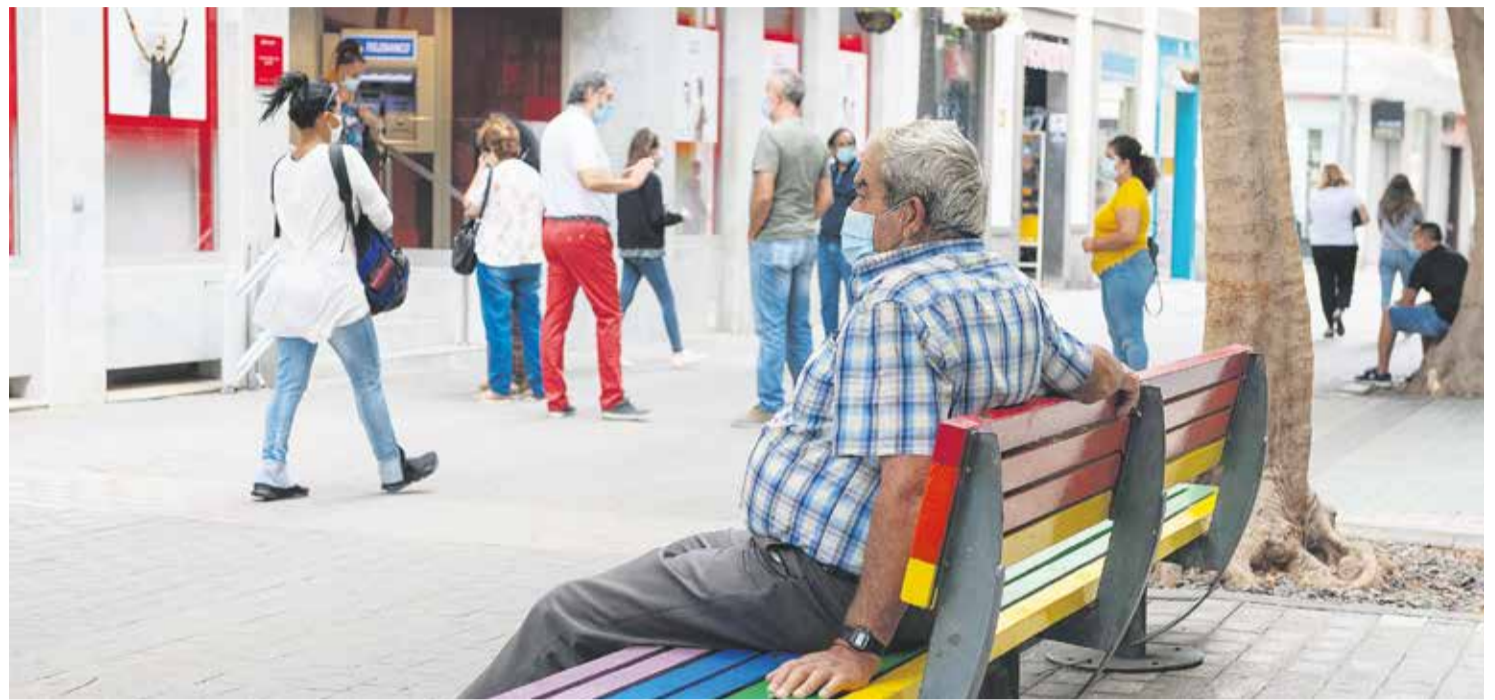
Aunque la edad no hace más vulnerable emocionalmente, los mayores están rememorando con la COVID épocas pasadas.

Sin embargo, con pocas ventajas más cuentan los residentes en la Isla, que han de cumplir con los únicos protocolos conocidos hasta la fecha para protegerse de las gotas infectivas: distancia social, higiene continua de manos