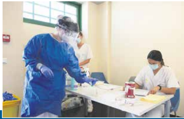
PRUEBAS PCR. La capacidad teórica que tiene en la actualidad el Hospital es de 1.000 pruebas al día. Se están realizando unas 400 por jornada, diez veces más que en la primera ola de la pandemia.