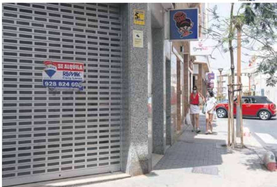
Negocios cerrados en Arrecife.