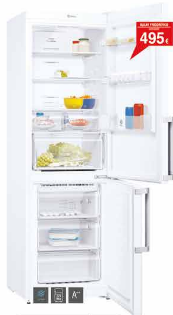
BALAY COMBI FRIGORÍFICO 3KF6615WE

304 Litros - Eficiencia energética A++ - Temperatura homogénea - Zona CollSelect - Easy Slide - Compresor Digital Inverter con 10 años de garantía - Luz LED - Sistema No Frost Total