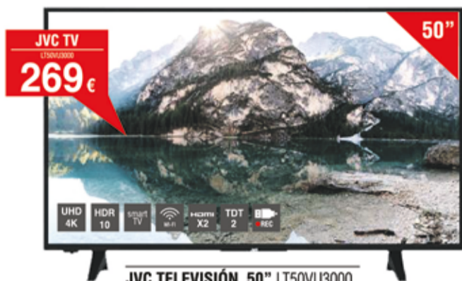
JVC TELEVISIÓN 50" LT50VU3000 Televisión LED de 50" UHD 4K - HDR10 - Smart TV - WiFi - USB Multimedia - Compatible con Alexa - TDT 2 - Satélite - VGA - 2 x HDMI