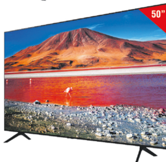
SAMSUNG TELEVISIÓN 50" 50TU7072 Televisión LED de 50" UHD 4K - HDR - Smart TV - WiFi - Ethernet - Bluetooth - 20 W de sonido - TDT 2 - Mega Contrast - Compatible AirPlay 2 - USB Multimedia - 2 x HDMI

UHD 4K HDR smart TV Wi-Fi HDMI X2 TDT 2 REC