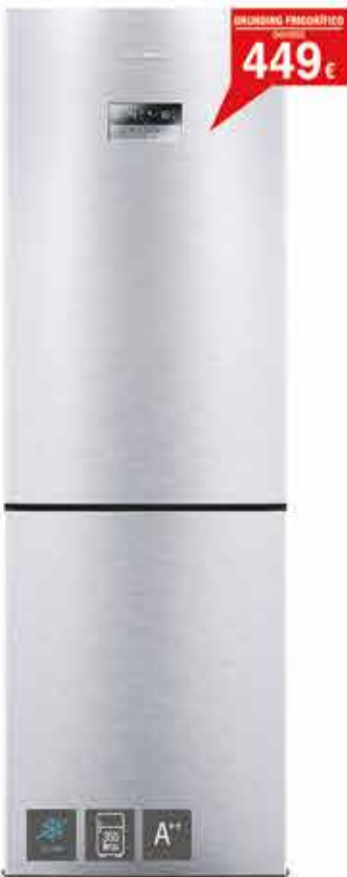
GRUNDING COMBI FRIGORÍFICO GKN16220

302 Litros - Eficiencia energética A+ - 8 niveles de termostato - Iluminación internet - Bandeja de cristal - Cajón de verduras - 175 cm de altura