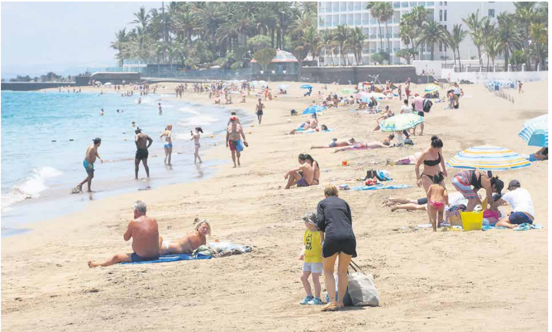
Aspecto de Playa Grande (Puerto del Carmen) este verano.