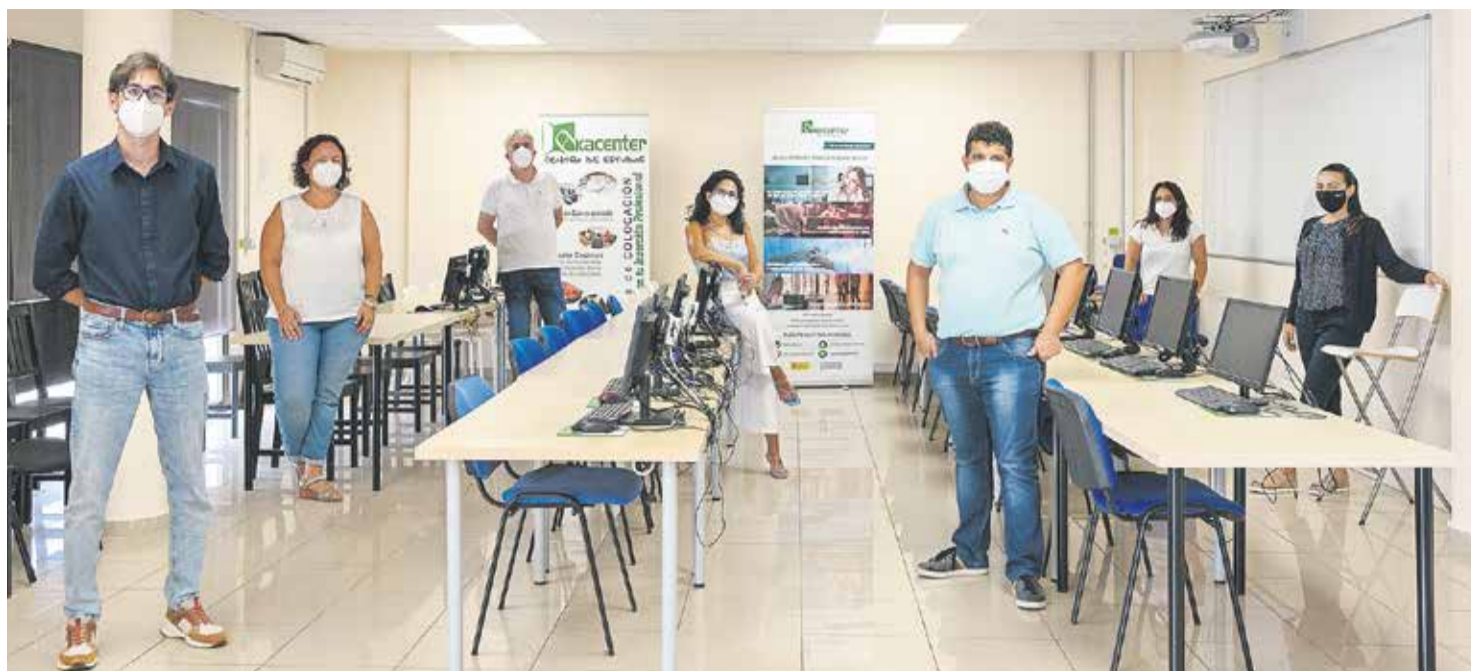
Equipo de Akacenter en la sede de Tías.

-Es una inmodestia decir esto, pero en mi familia eran adelantadas. Y no solo las mujeres. Dos hermanos de mi abuela eran funcionarios del Ayuntamiento y otros se fueron a América, donde montaron academias de música y de enseñanza. En el caso concreto de las mujeres estoy muy satisfecho y es verdad que ese talante me influyó muchísimo, aunque es posible que de forma inconsciente.