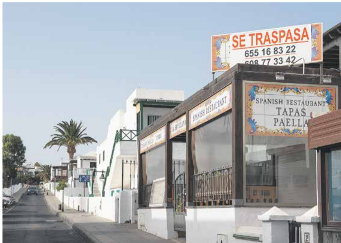
Puerto del Carmen.

Por otra parte, hay más datos que revelan la mala situación económica de la Isla durante y tras la pandemia. Las afiliaciones a la Seguridad Social, según los datos del Ministerio de Trabajo, han registrado grandes descensos desde el mes de marzo. Ya son casi 5.000 personas